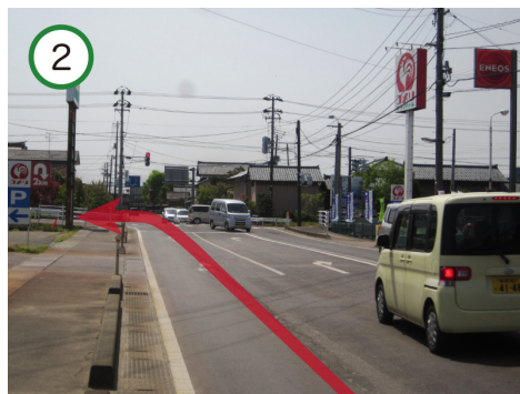
49号線が交わる交差点を左に 曲がり弧線橋を渡る（コメリを 目印）も