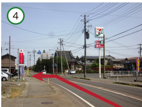
入り口が見えます。 セブンイレブンを目印に！