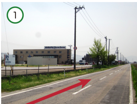
豊栄方面から水原へ。 水原自動車学校を通ります。