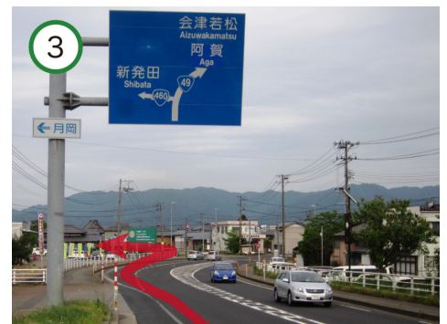
弧線橋を下った信号を左手に 曲がる